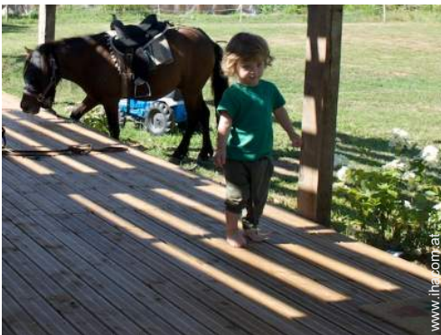
Pferde und Reitausrüstung