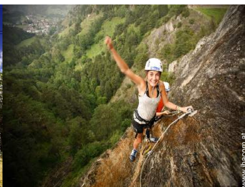
Via ferrata (Klettersteig)