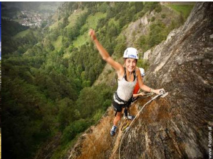
Via ferrata (Klettersteig)