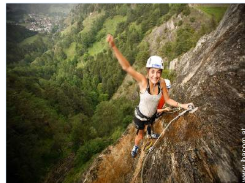
Via ferrata (Klettersteig)