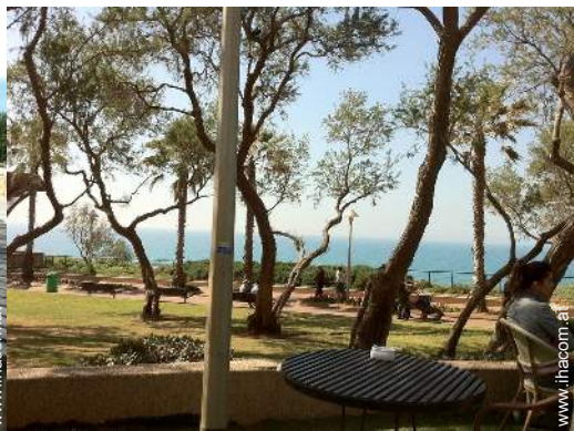
Park und Garten