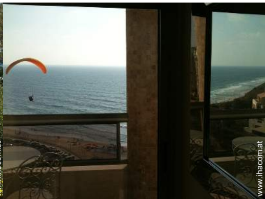
Flugsport in der Nähe