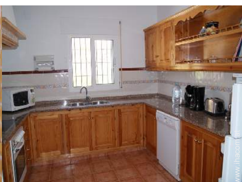
große amerikanische Küche