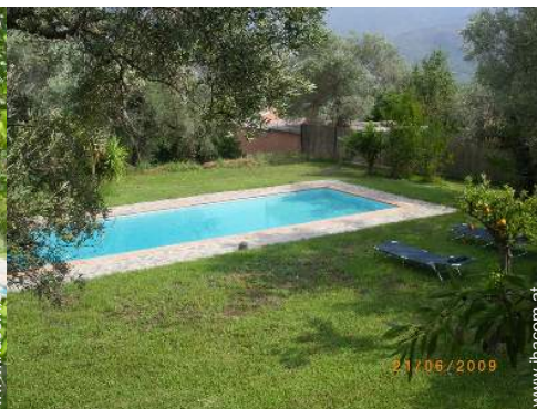
Swimmingpool in Wohnanlage