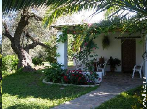
Blick aufs Land