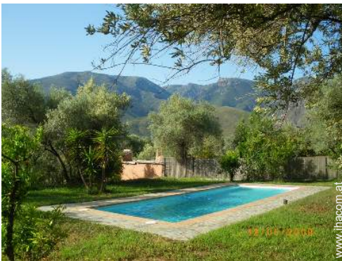
Swimmingpool in Wohnanlage