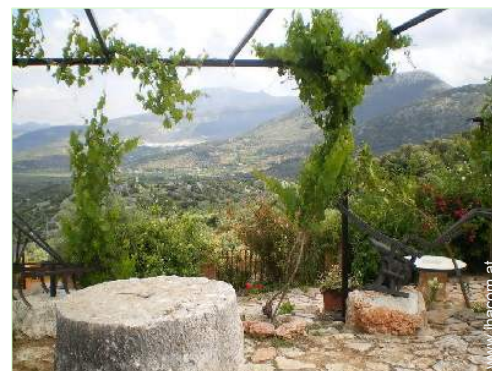
Blick auf Felder