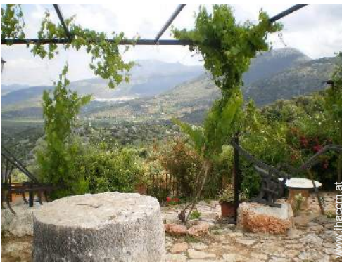
Blick auf Felder