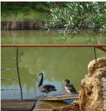
Vor Ort anwesend