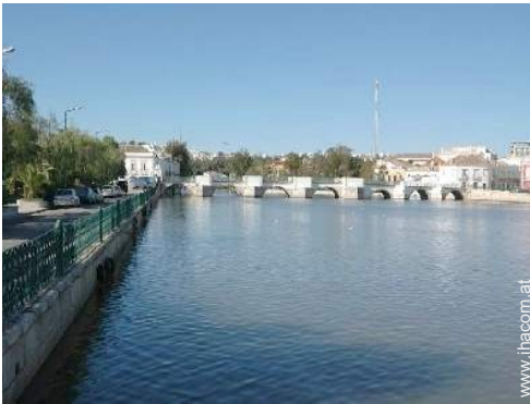
Blick auf Stadtzentrum