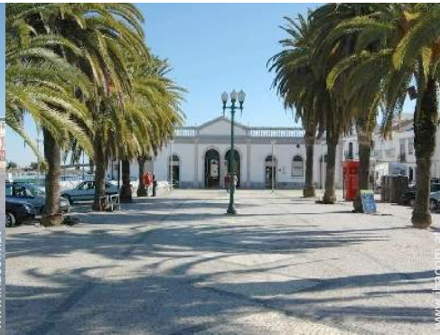
Blick auf Stadtzentrum