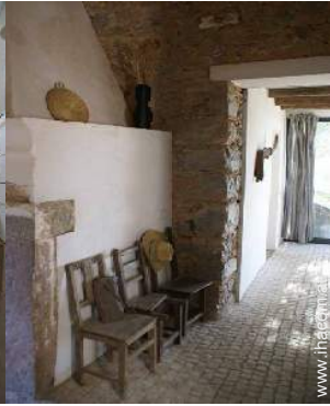
ehem. Bauernhof mit Charme