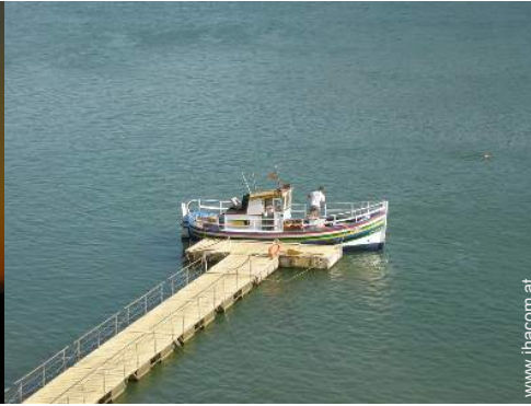
Flugsport in der Nähe