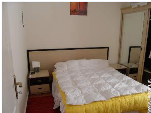
Innenkomfort und Ausstattung