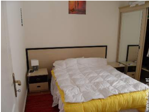
Innenkomfort und Ausstattung